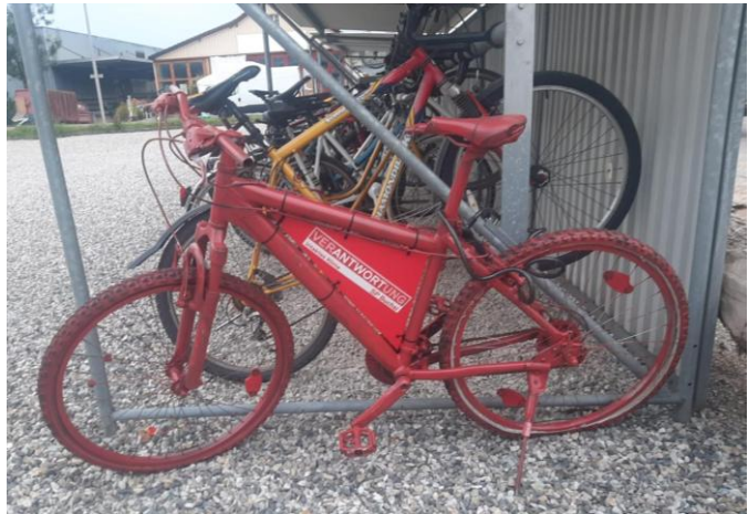
Abbildung 6 Wahlkampfvelo