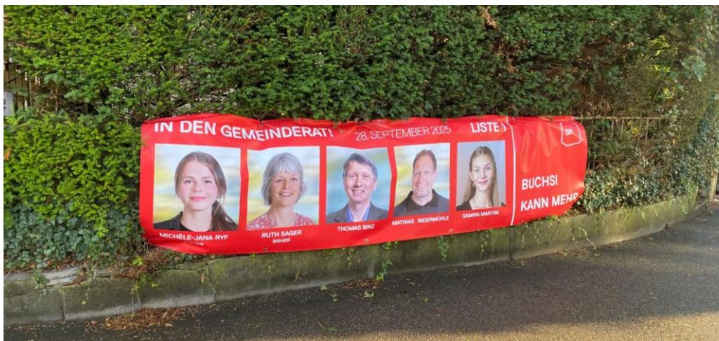
Abbildung 7 Wahlblache vor dem Diebstahl

Unsere Wahlblache in Bahnhofsnähe kam während des Wahlkampfs insgesamt drei Mal abhanden. Dies ist für uns ein gänzlich neues Phänomen und stimmt uns sehr bedenklich, da wir davon ausgehen müssen, dass unsere Wahlblachen aus politischen Gründen verschwunden sind. Was die Täter indes damit bezwecken wollten, ist unklar. Unterkriegen liessen wir uns davon jedenfalls nicht und auch unserer Motivation blieb ungebrochen hoch.