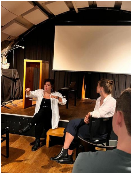
Abbildung 11 Tamara Funicello

Im September war Nationalrätin Tamara Funicello bei uns zu Gast. Sie referierte über Vereinbarkeit von Familie und Beruf, Gleichstellung und Kinderbetreuung. Im Anschluss an das Referat bestand noch die Möglichkeit Tamara Fragen zum Thema zu stellen und Unklarheiten aus der Welt zu schaffen.