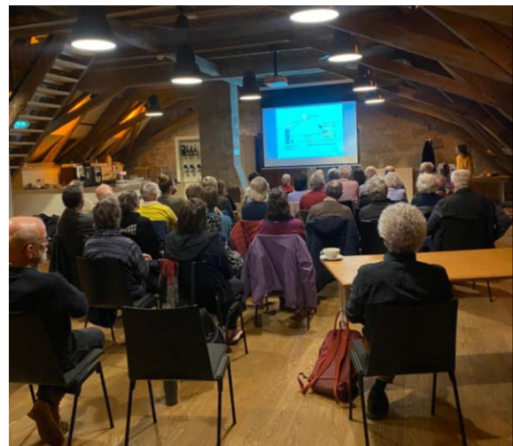
Abbildung 1 Filmvorführung im Dachstock

Im Anschluss an unserer HV wurde vom Lokalkomitee der Konzernverantwortungsinitiative ein Film über die Verwicklungen von Schweizer Konzernen in zweifelhafte Geschäfte in Peru und auf Borneo gezeigt. Danach fand eine Diskussionsrunde statt.