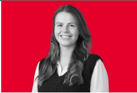
Michèle – Jana Ryf

«Eine Steigerung der Lebensqualität für alle: Chancengleichheit und Klimaschutz.»