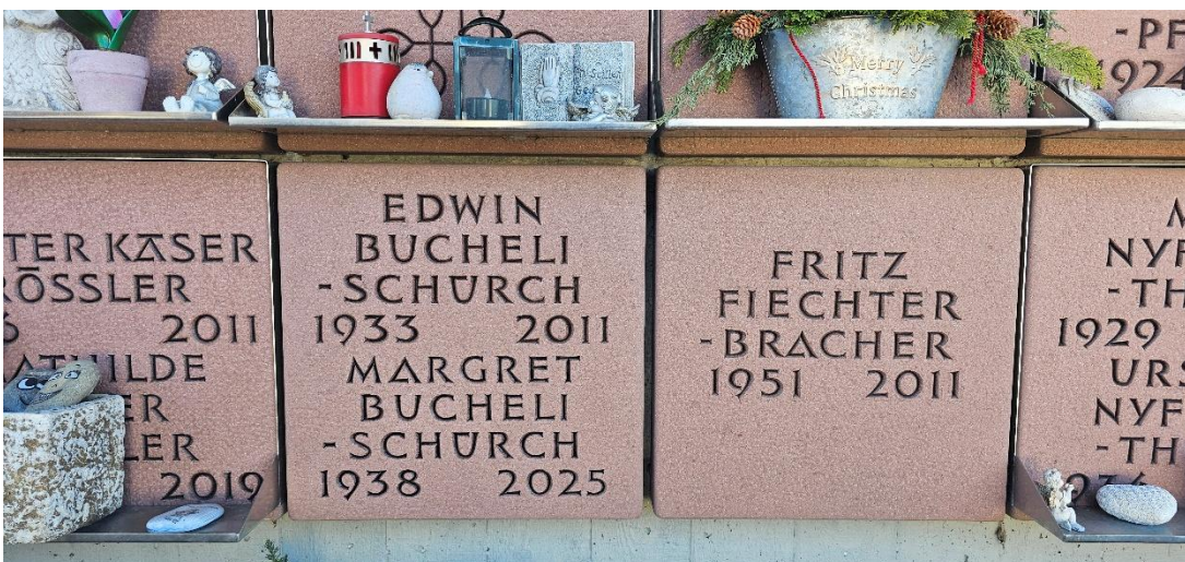
Drei SP Urgesteine im Tode vereint